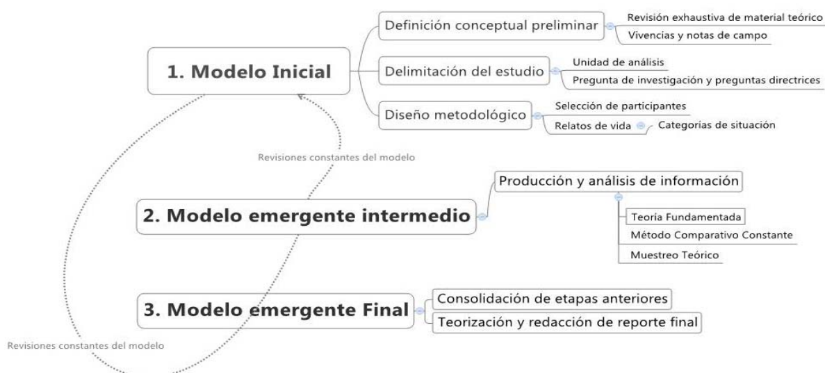
Figura 2. Fases de la construcción de un modelo comprensivo de análisis

Por otro lado, es pertinente retomar en este apartado lo referido al punto de saturación y relatos de vida provisionalmente terminados. Esto, pues si bien se ha llegado a la construcción final de un modelo emergente, no podemos obviar su carácter dinámico en tanto se aleja de la configuración de un modelo estrictamente acabado (Figura 2). Se instala más bien, como una plataforma que invita a trabajos futuros a repensar de manera constante la representación de la situación de inmigración.